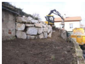
◆ Travaux publics—Démolition