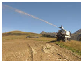
◆ Stabilisation des sols par engazonnement hydraulique