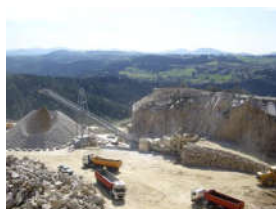
◆ Carrière—Livraison de matériaux