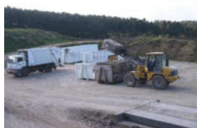
◆ Location et enlèvement de bennes à déchets